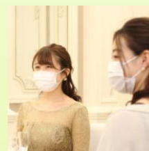
お客様への マスク着用をお願い