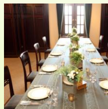
余裕をもった 配席の提案