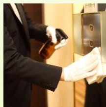
館内の定期的な消毒