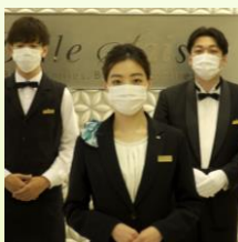
スタッフのマスク着用